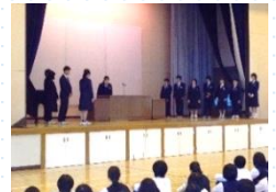
【新旧役員引き継ぎ式】